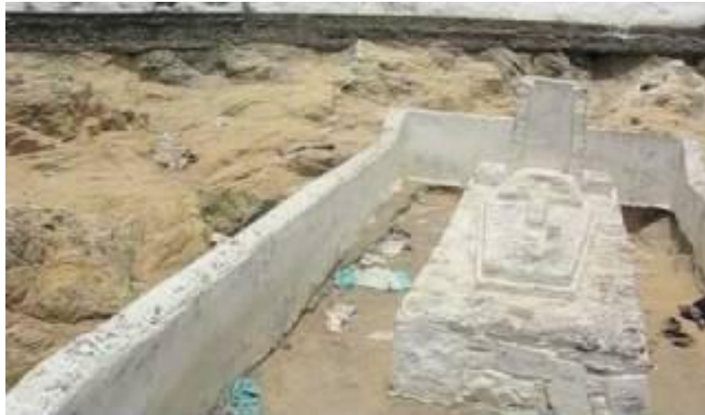
Grab von Anton Wilhelm Amo am Fuß der Festung Shama/ Ghana

1739 hing am schwarzen Brett der Universität Jena eine Vorlesungsankündigung für die Studenten aller Fakultäten. Der Titel lautete: „Partes philosophiae et curiosae Physiognomiam, Chiromatiam, Geomantiam, vulgo Punctir-Kunst, Astrologiam mere naturalem, et quae opponitur Cryptographiae, artem Dechifroriam, quam Dechifrier-Kunst vocant (...)“ Das Ungewöhnliche daran war, dass der Verfasser ein Afrikaner war: Doktor der Philosophie Anton Wilhelm Amo. Unter seinen Zeitgenossen war er eine bekannte und geschätzte Persönlichkeit. Ein afrikanischer Gelehrter an einer deutschen Universität, das war eine Sensation im Europa des 18. Jahrhunderts. 1