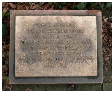
Amo-Gedenkstein Inschrift: „Dem Andenken Anton Wilhelm Amos aus Axim in Ghana. Dem ersten afrikanischen Studenten und Dozenten der Universitäten Halle-Wittenberg und Jena 1727-1747“

1739 hing am schwarzen Brett der Universität Jena eine Vorlesungsankündigung für die Studenten aller Fakultäten. Der Titel lautete: „Partes philosophiae et curiosae Physiognomiam, Chiromatiam, Geomantiam, vulgo Punctir-Kunst, Astrologiam mere naturalem, et quae opponitur Cryptographiae, artem Dechifroriam, quam Dechifrier-Kunst vocant (...)“ Das Ungewöhnliche daran war, dass der Verfasser ein Afrikaner war: Doktor der Philosophie Anton Wilhelm Amo. Unter seinen Zeitgenossen war er eine bekannte und geschätzte Persönlichkeit. Ein afrikanischer Gelehrter an einer deutschen Universität, das war eine Sensation im Europa des 18. Jahrhunderts. 1